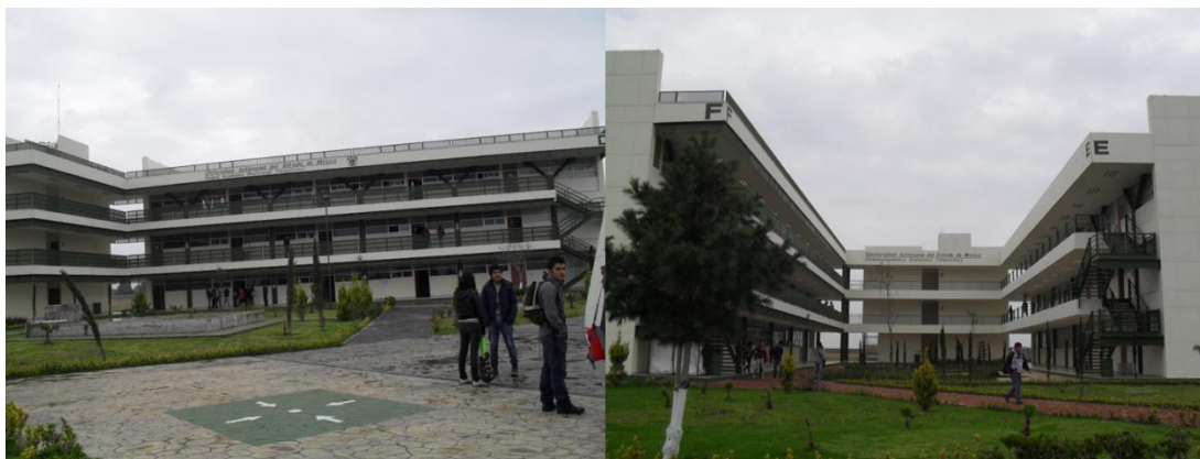
Edificios D, E y F de la Unidad Académica Profesional Tlanguistenco

con 40 salones de los cuales cuatro son aulas digitales. Además de 2 salas y 6 laboratorios de cómputo, 7 laboratorios, entre los que se encuentran el de manufactura, metrología, electricidad y magnetismo, química, cámara Gesell, prototipos y criminalística, 2 talleres, todo esto dividido en cinco edificios, que ocupan un área de 9 532 m 2 .