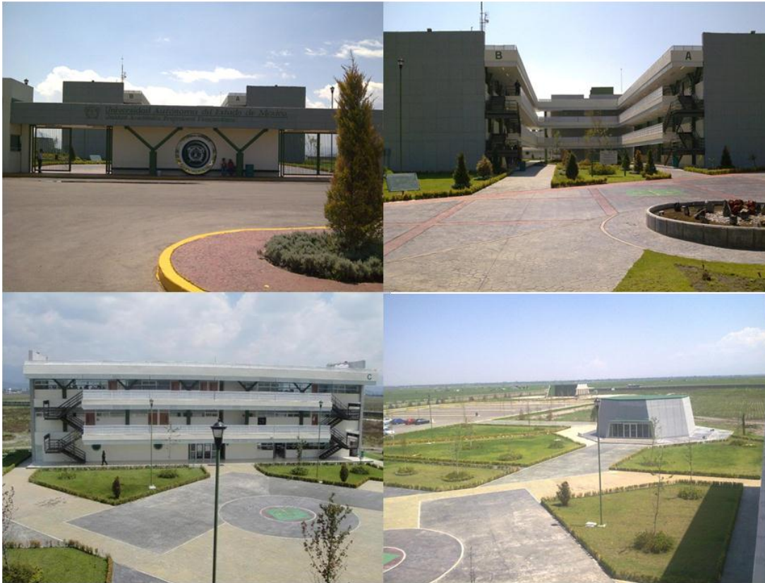
Fachada, edificios A, B y C, módulo cultural de la Unidad Académica Profesional Tianguistenco